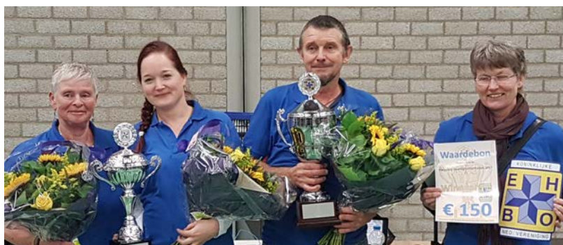
De winnaars van de NVP 2017